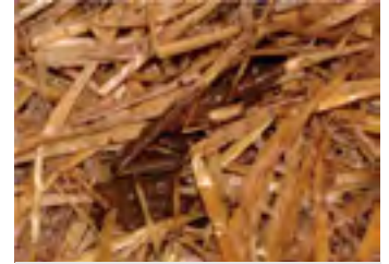
Diarrea producto de la Coccidiósis.