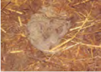
Diarrea producto de leche en el rumen.

Las Cápsulas Dosto son un suplemento alimenticio para terneros que estabiliza el balance electrolítico y el agua. Contienen aceites orgánicos naturales. Son recomendadas en el caso de riesgo, tratamientos largos o recuperación de problemas digestivos (diarrea). Cápsulas Dosto son fáciles de usar con la ayuda del aplicador incluido.